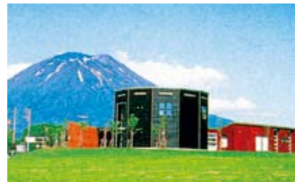
Niseko View Plaza ☎01398 174 590 ▶詳細見P12