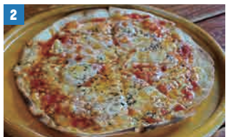
圖 青森縣十和田市大字奧瀨字新久保182番地 奧入瀨湧水館2F 圖+81-176-70-5977 圖從JR八戶站西口搭乘巴士60分 ※奧入瀨溪流雪地散步 期間：12月下旬~4月上旬 大人(高中生以上)6,000圓日幣 小孩(國中以下)3,000圓日幣 ※可租借雪地裝備 圖 http://www.nexgh.com/ (日文) 春夏的奧入瀨溪流的資訊於「最新日本-青森&岩手特集」中有介紹，請參考。 圖 http://visit-japan.jp/features/32/rouhoku

為了傳遞大自然的魅力，於奧入瀨、十和田湖、南八甲田等地推出自然導覽行程，除了這回介紹的雪地散步，還提供獨木舟體驗及大自然散步等感受各季節風采的導覽行程。