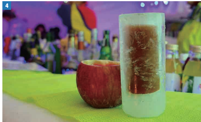
圖 十和田市十和田湖畔休屋(十和田湖畔休屋特設活動會場) 圖+81-176-75-2425 舉辦期間：2月 圖從七戶十和田站開車約90分 圖 http://towadako.or.jp/event/post/790/ (日文)

從1999年至今，於每年2月在十和田舉辦的活動。期間除了冬季火花及夜間彩燈秀，還能欣賞鄉土藝能、品嚐鄉土料理，以及感受在雪屋裡飲酒的樂趣哦！